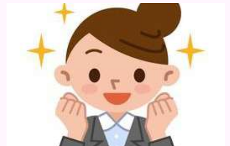
仕事一筋にがんばってきました